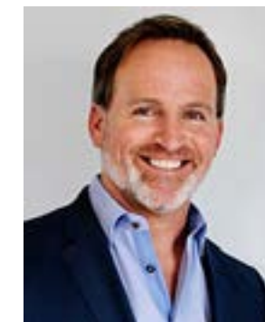
Bryan C. Hanson Πρόεδρος και Διευθύνων Σύμβουλος

Κάθε μέρα, δεσμευόμαστε να τηρούμε τα υψηλότερα πρότυπα ασφάλειας για τους ασθενείς μας και ποιότητας στα προϊόντα και τις υπηρεσίες μας, καθώς και για ακεραιότητα και διατήρηση δεοντολογικών επιχειρηματικών πρακτικών παγκόσμιας κλάσης.